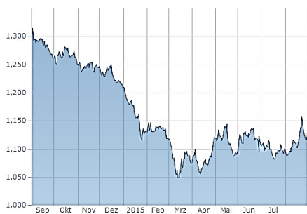
Euro-Dollar Kurs (1 Jahr)